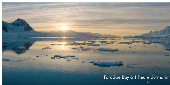
Paradise Bay à 1 heure du matin

Paradise Bay est une baie située derrière les îles de Lemaire et de Bryde. Quand l'équipe de L'Odysée arrive sur place, elle est subjuguée par la beauté de ce lieu où le soleil ne se couche jamais.